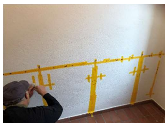
Anpassungsarbeiten für die neue Tagesstruktur im Pfarrhaus