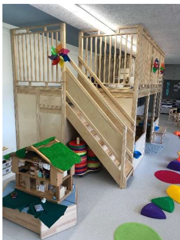
Blick in den neuen Kindergarten